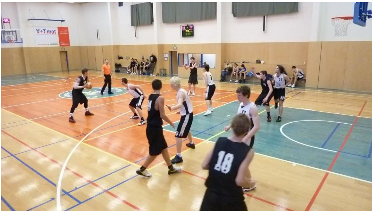
U17 v zápase s Kutnou Horou