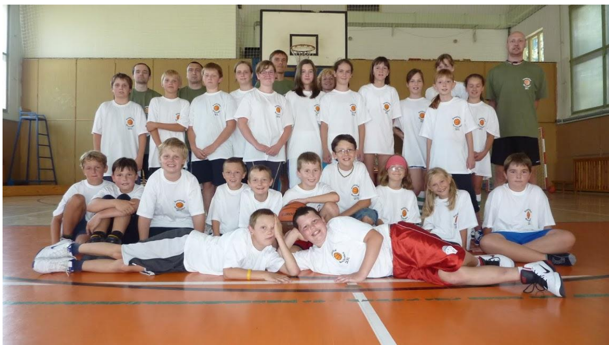
Ze soustředění v Nové Bystřici