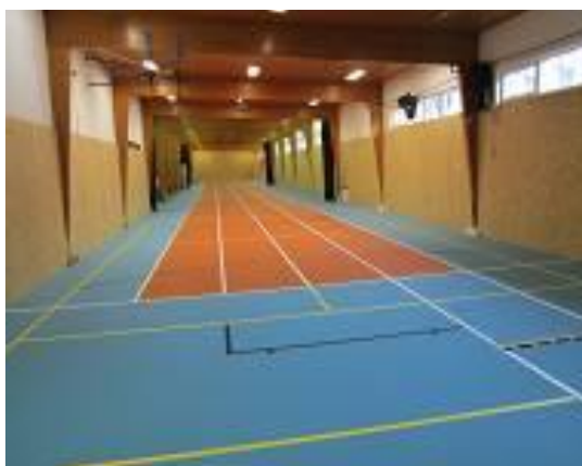
Krytá běžecká dráha

V roce 2013 chceme nadále organizovat veřejné závody v KBD, ve spolupráci se školami v Českém Brodě bychom se rádi podíleli na uspořádání školních atletických závodů a ve spolupráci s fotbalovým klubem na dětském dnu. Do programu Leader jsme podali žádost o dotaci na rekonstrukci vrhačských sektorů a brigádnicky plánujeme vylepšit způsobilost běžeckého oválu k tréninku. Získáním a proškolením nových trenérů chceme zkvalitnit tréninkový proces, zejména v práci s mládeží a tím dosáhnout i lepších sportovních výsledků.