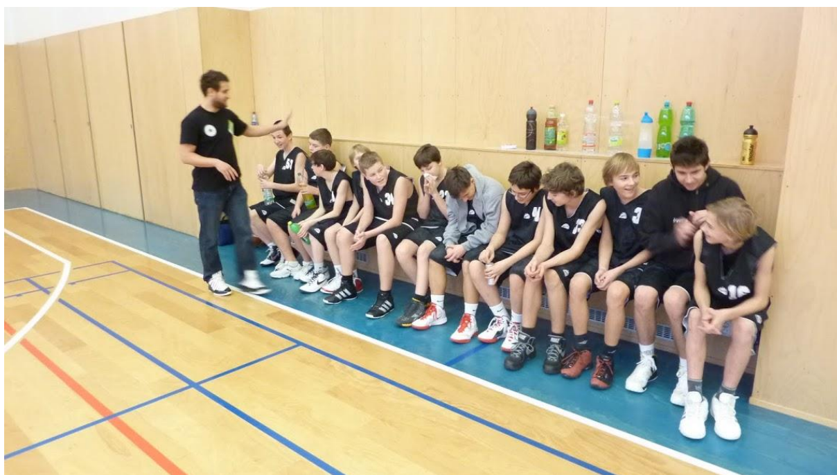
U14 – zápas proti USK

Celkem má BK 66 mládežnických členů, faktický stav – zejména díky začínajícím dětem, u kterých dochází k častým změnám, kolísá okolo čísla 75 již třetím rokem. Zároveň kolísá i díky častým výměnám podle potřeby vyšších soutěží v kooperaci s Nymburkem