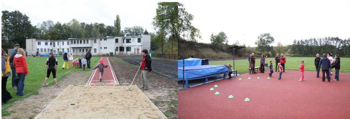
Dětský den v areálu Na Kutilce 14. 10. 2012

Dne 14. října uspořádal oddíl ve spolupráci s fotbalovým klubem SK Český Brod v areálu Na Kutilce dětský sportovní den, kterého se zúčastnilo ke stovce dětí v doprovodu rodičů. Na akci byly slavnostně uvedeny do provozu zrekonstruované atletické sektory.