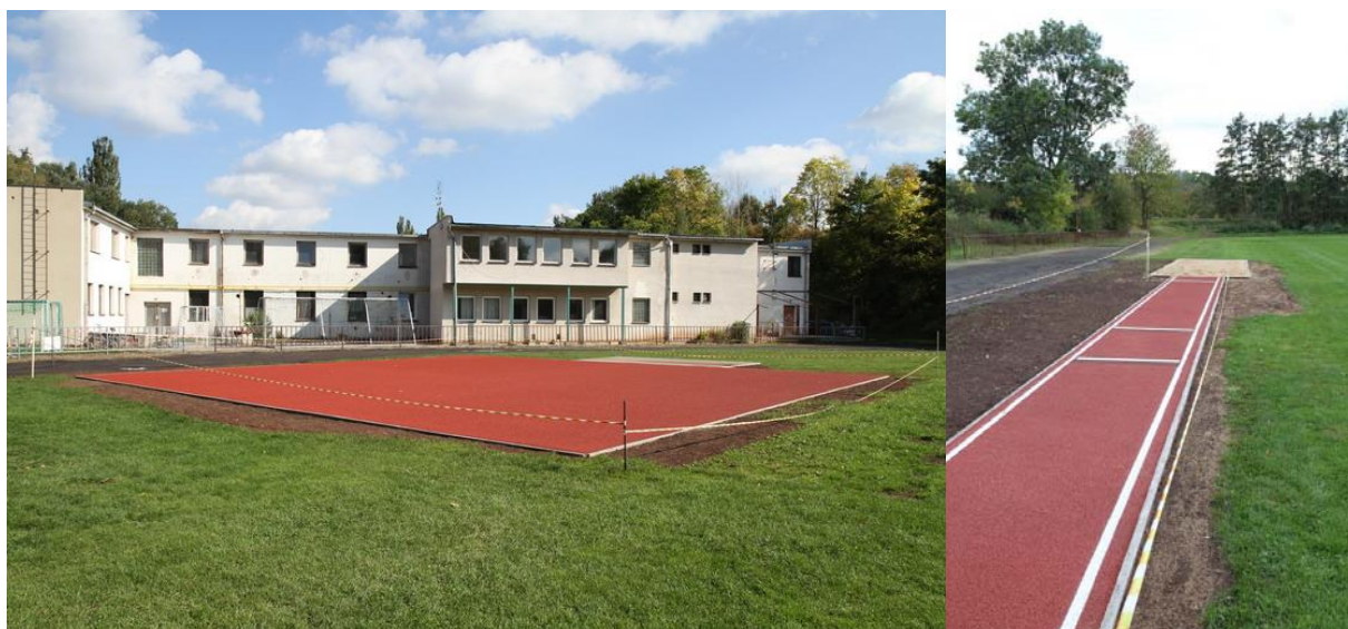
Rekonstruované sektory pro skok vysoký a skok daleký