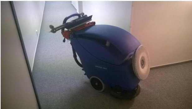
Čisticí stroj na úklid sportovní haly