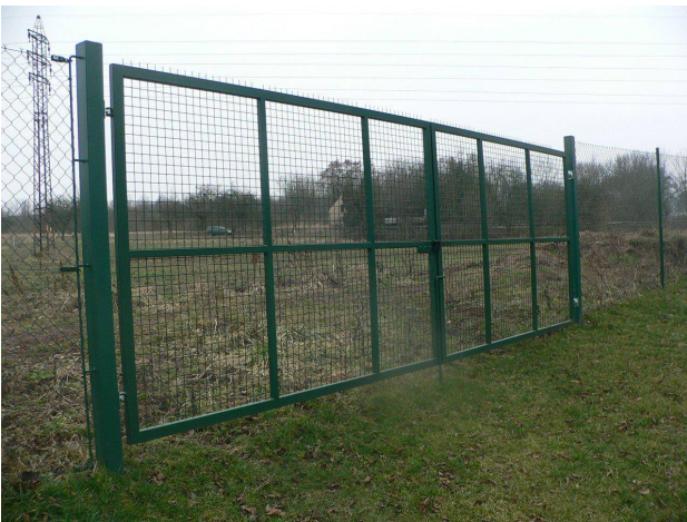
Plot na Kutilce ( SK ve spolupráci s TJ)