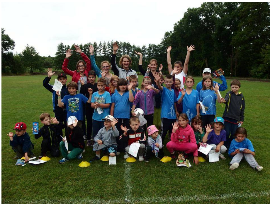
Poslední trénink před letními prázdninami 2014