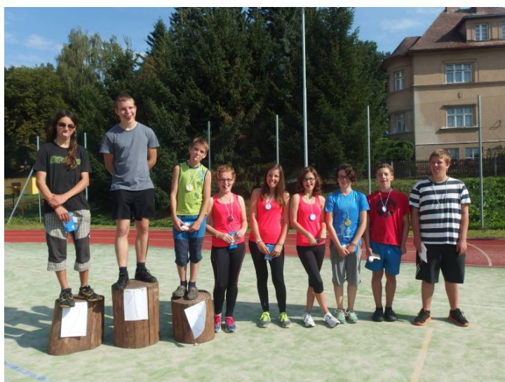
Letní soustředění v Hostinném