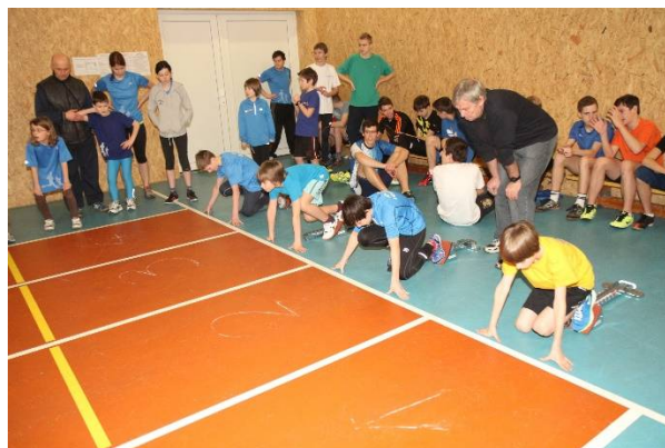
Atletické závody v Českém Brodě 25. 1. 2014

Družstva přípravek soutěžila v sedmi závodech přípravek. Dva ze závodů organizoval náš oddíl v kryté běžecké hale. Na dalších pět závodů vyrážela družstva přípravek se svými trenéry do měst Středočeského kraje. Oddíl takto spolupracoval s několika oddíly, pro které také závody organizoval (SKP Nymburk, AC Čáslav, Sokol Kolín). Závody se konaly jak v krytých halách, tak na atletických oválech. Jednotlivci z přípravek se také účastnili veřejných závodů v Českém Brodě pořádaných oddílem atletiky, dalších závodů pořádaných SKP Nymburk a běžeckých závodů v Českém Brodě organizovaných oddílem triatlonu TJ Slavoj Český Brod.