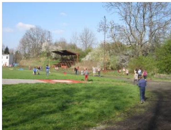
Brigáda na atletickém stadionu 11. 4. 2014