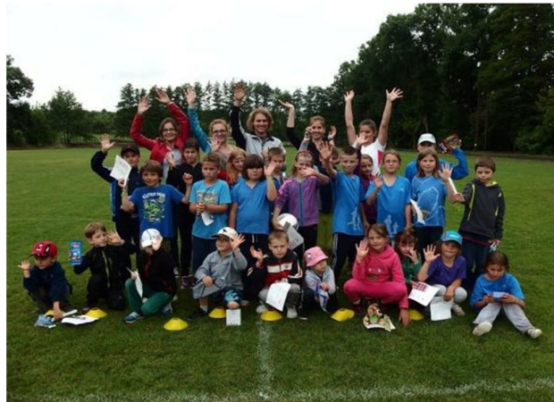
Poslední trénink před letními prázdninami 2015