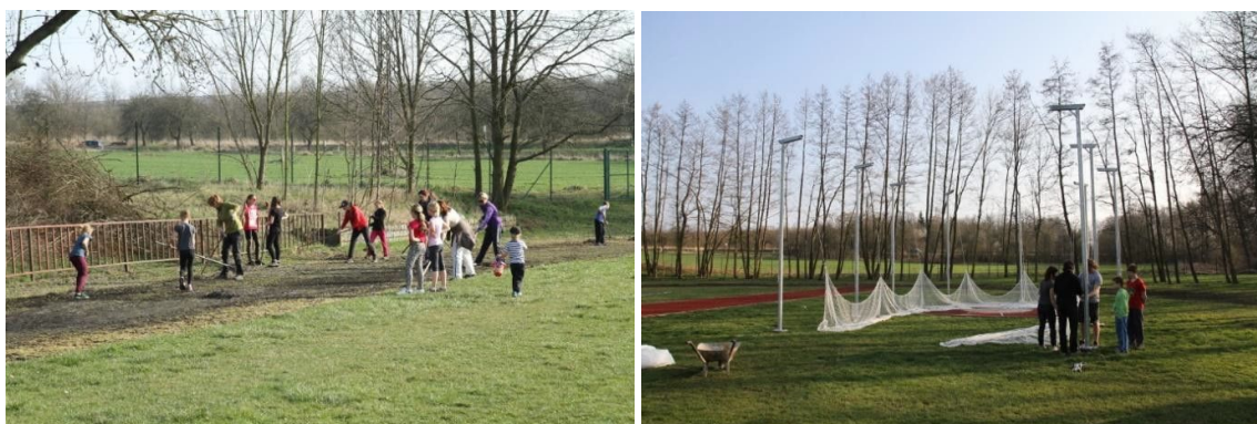
Brigáda na atletickém stadionu 10. 4. 2015

Pro tréninkovou činnost jsme opět využívali atletický stadion Na Kutilce a v zimním období pak krytou běžeckou dráhu. Členové oddílu se začátkem letní sezony podíleli brigádnickou činností na úpravě běžecké dráhy a zprovoznění sektorů. Po ukončení sezony zazimovali sektory dálky, výšky a hodů. Bohužel se nám opět nepodařilo získat finanční prostředky na rekonstrukci atletického stadionu z výzvy MŠMT. V roce 2015 tak bylo alespoň zásluhou SK fotbal dokončeno oplocení od tribuny na atletickém stadionu a podél fotbalového hřiště až k vstupní bráně a celý areál je tak nyní uzavřen.