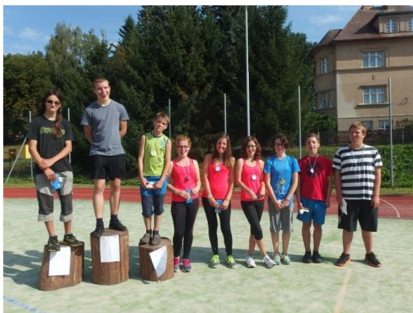
Letní soustředění v Hostinném

Oddíl bude v roce 2016 soutěžit v rámci Středočeského kraje ve družstvech mužů, žen, mladších žáků, mladších zákyň, přípravky chlapců a dívek. V soutěži jednotlivců se zúčastníme krajských přeborů, případně i vyšších soutěží. Budeme nadále organizovat veřejné atletické závody v KBD. Uspořádáme nejméně dva závody přípravek v KBD a závod přípravek na atletickém hřišti Na Kutilce. Budeme se podílet upořádání sportovních akcí v areálu Kutilka.