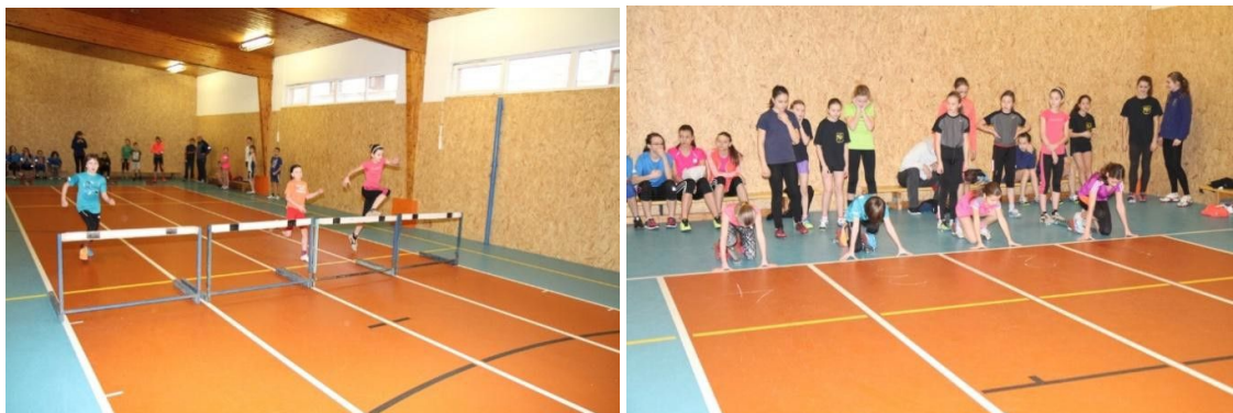
Atletické závody v Českém Brodě 14. 2. 2015

Při závodech v atletice soutěží jednotlivec proti dalším jednotlivcům a to jak v individuálním závodě, tak v soutěži družstev. Výjimkou jsou štafety. Vždy se jedná o co nejlepší umístění každého jednotlivého závodníka. Výkon je vzájemným výkonnostním porovnáním závodníků v jedné disciplíně v oblasti kraje či republiky.