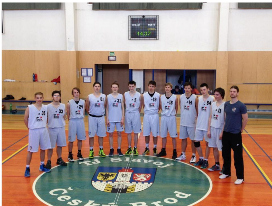
Družstvo mladších dorostenců