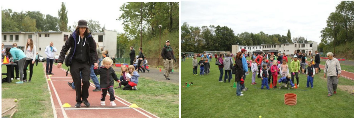
Kutilka v pohybu 27. 9. 2015

Dne 27. 9. jsme ve spolupráci s dalšími neziskovými organizacemi uspořádali další sportovní den v areálu Na Kutilce pod názvem Kutilka v pohybu.