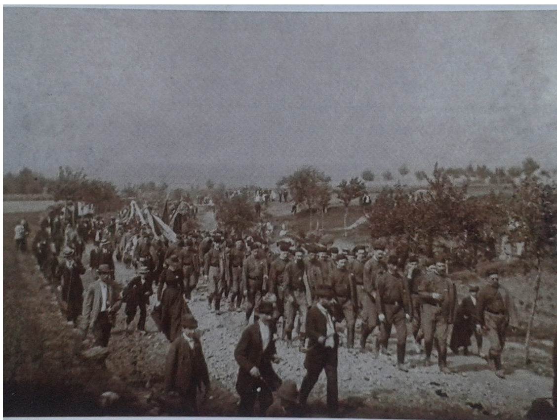
1. Lipany, pout' do Lipan, rok 1881