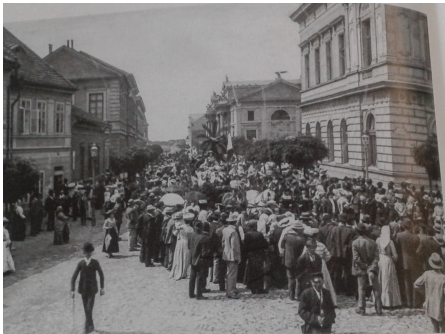
5. Český Brod, Dětská slavnost s průvodem, 11. července 1906