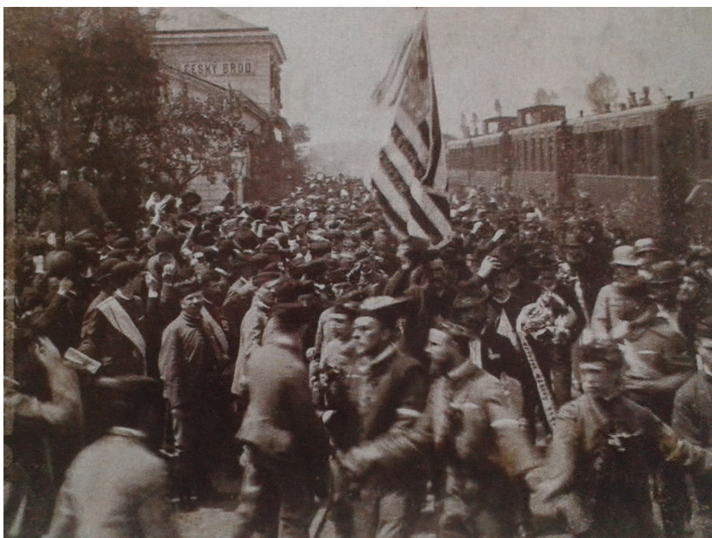
3. Český Brod , přivítání amerických sokolů na českobrodském nádraží, 26. června 1887