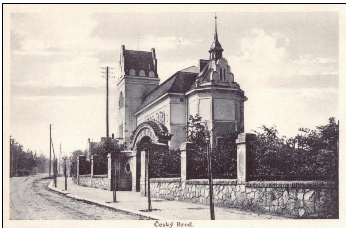
13. Český Brod, budova muzea, 1929, pohled od východu