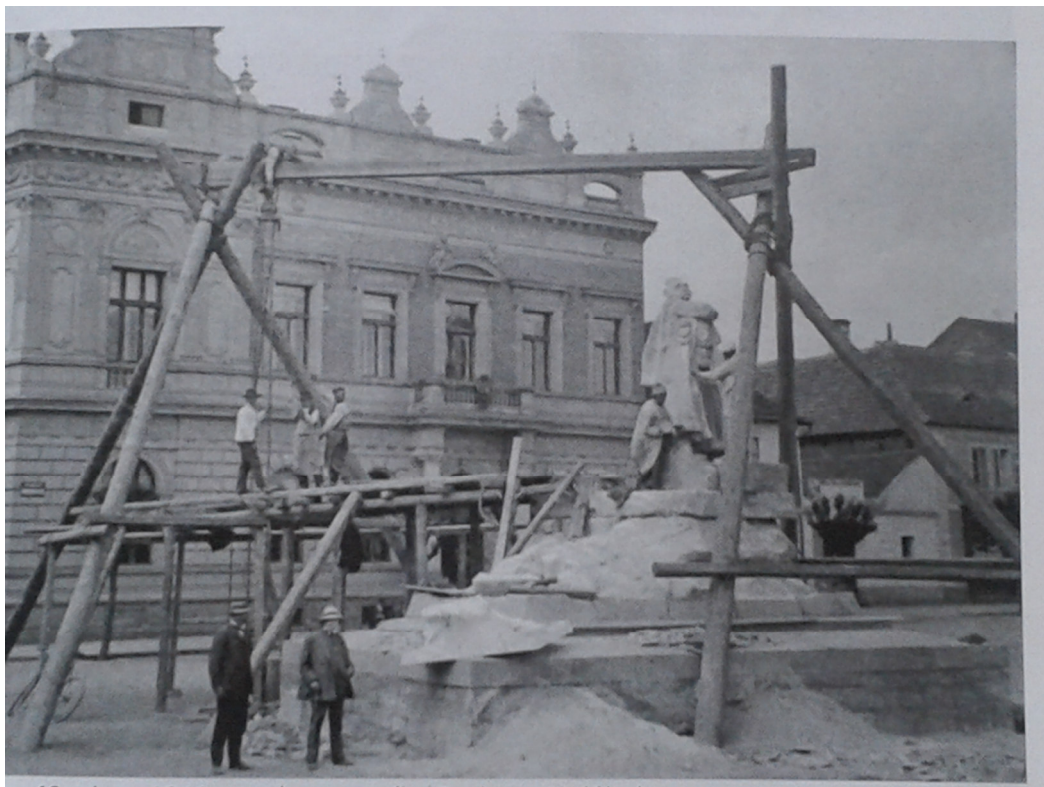
6. Český Brod, stavba pomníku Prokopa Holého, jaro 1910