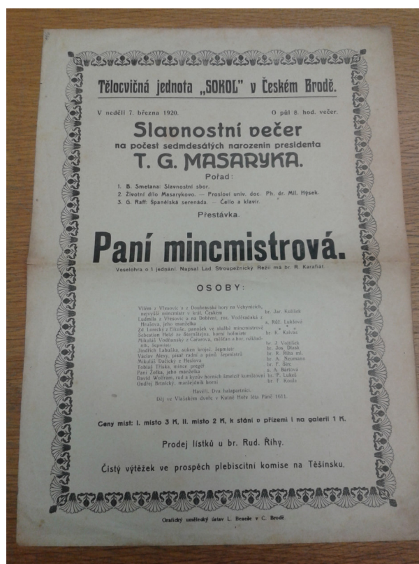
10. Český Brod, plakát ke hře Paní mincmistrová, 7. března 1920