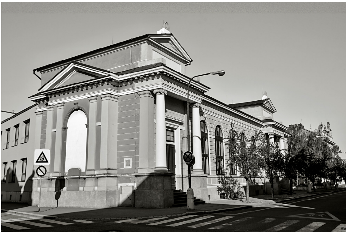
11. Český Brod, budova sokolovny, 2017, pohled od západu