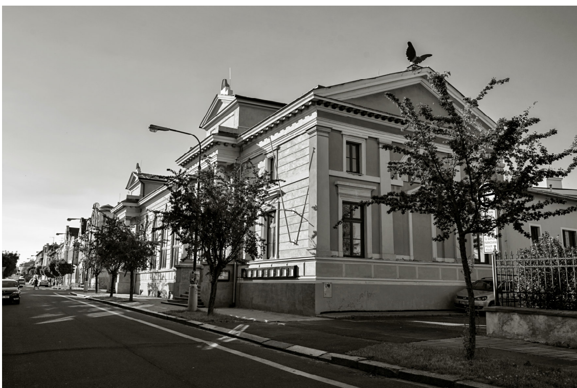
12. Český Brod, budova sokolovny, 2017, pohled od východu