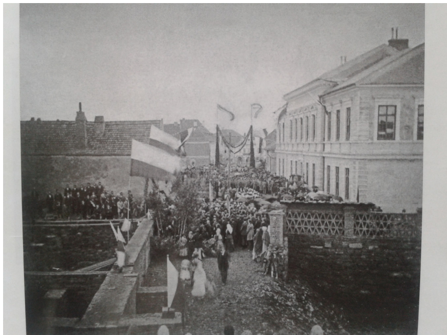
2. Český Brod , položení základního kamene českobrodské sokolovny, 15.června 1884