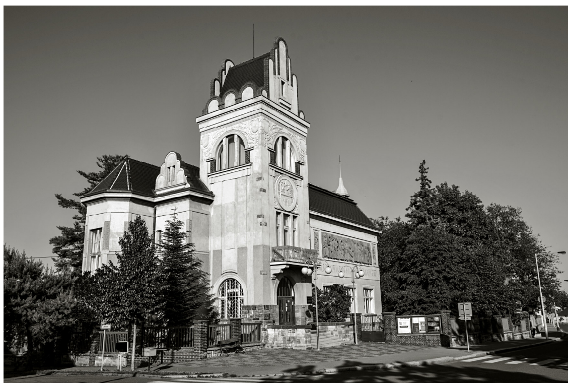
14. Český Brod, budova Podlipanského muzea, 2017, pohled od západu