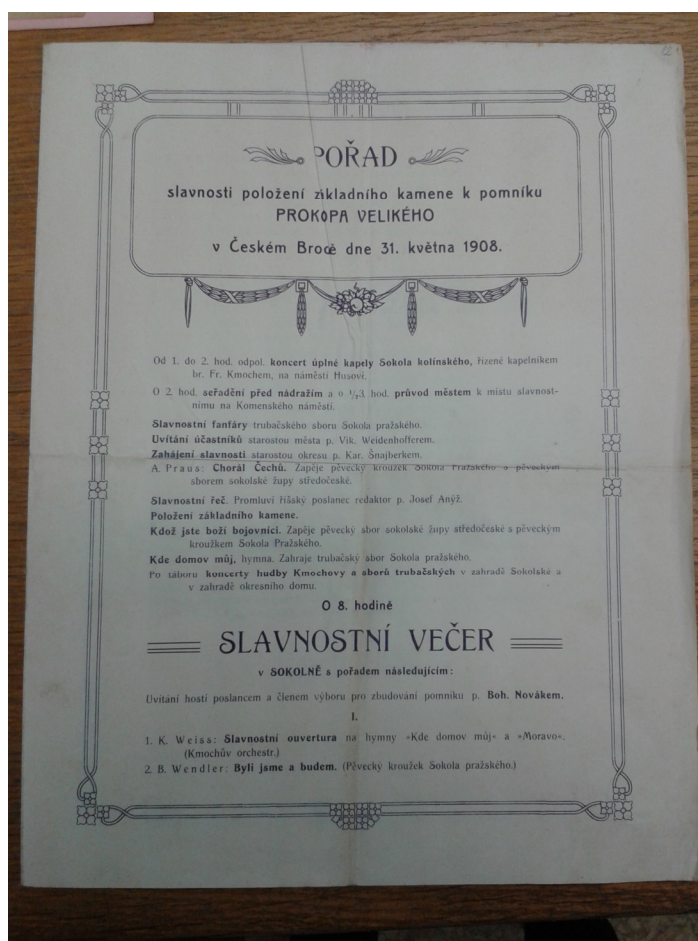
7. Český Brod, plakát k oslavám položení základního kamene pomníku Prokopa Velikého