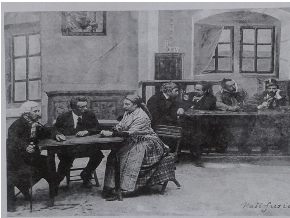
9. Český Brod, hra Naši furiant, 1900